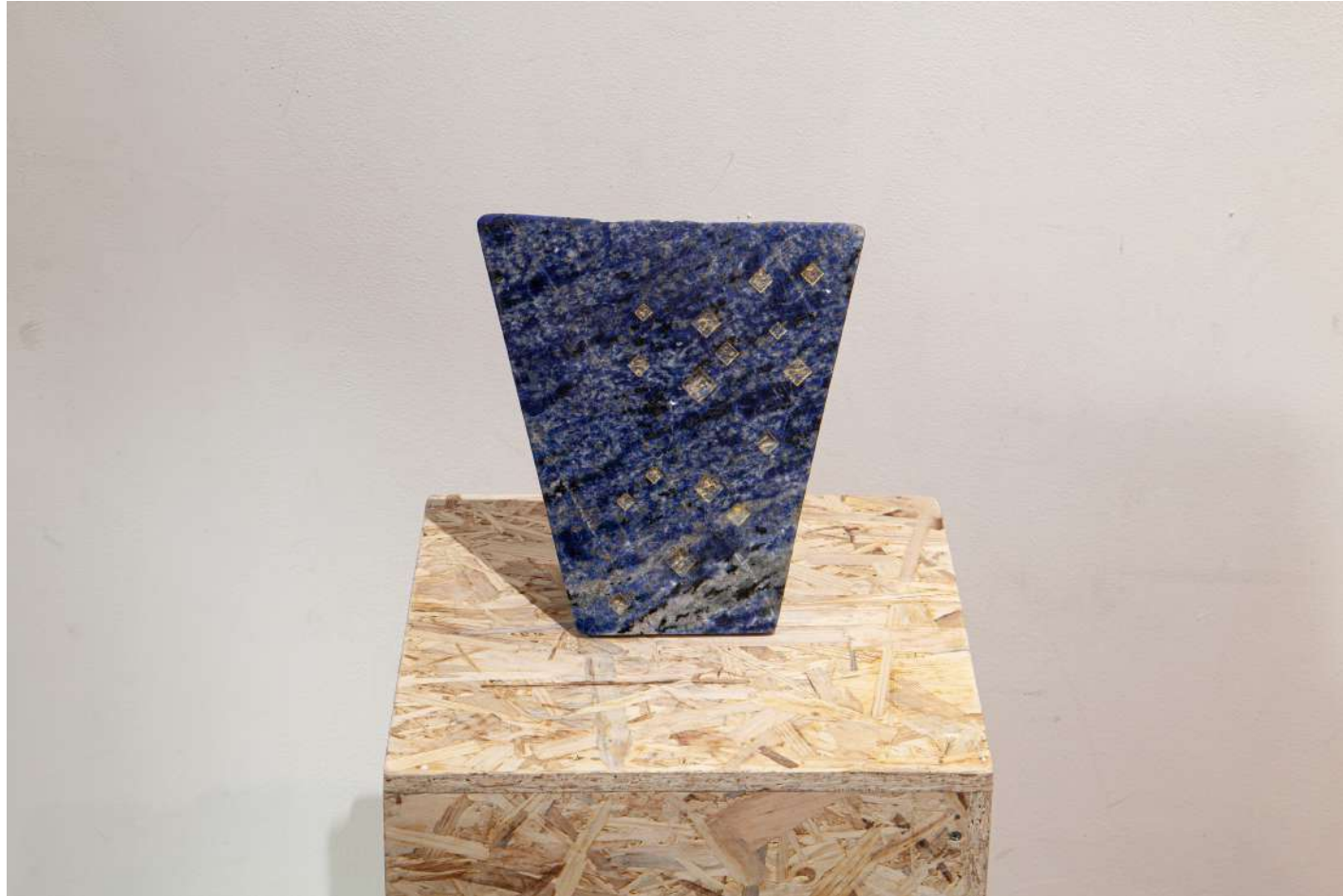
[ 地球の聲 '23-1 / Voice of the earth 1 ] 2023年 / 花崗岩 / 20,2×19,8×7,8(cm)