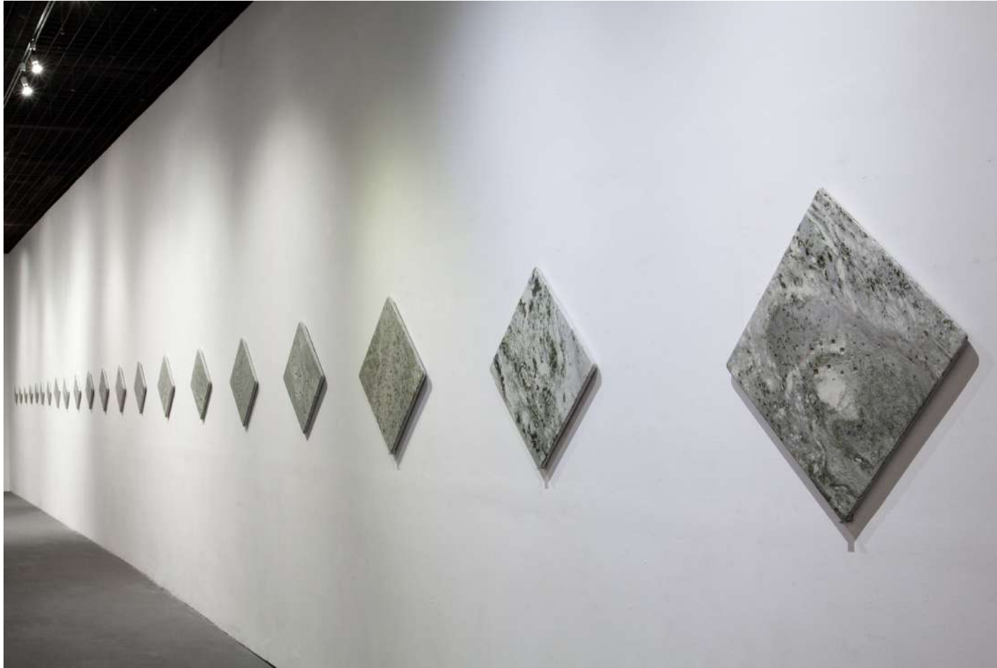
[ 石の声 1~21 / Stone poem '23-1~21 ] 2023年 / 大理石