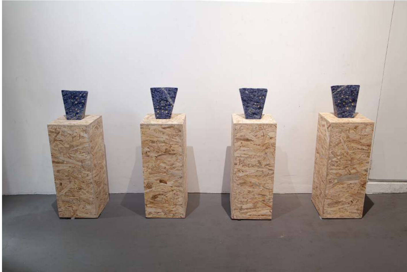
[ 地球の聲 '23-1~4 / Voice of the earth 1~4 ] 2023年 / 花崗岩