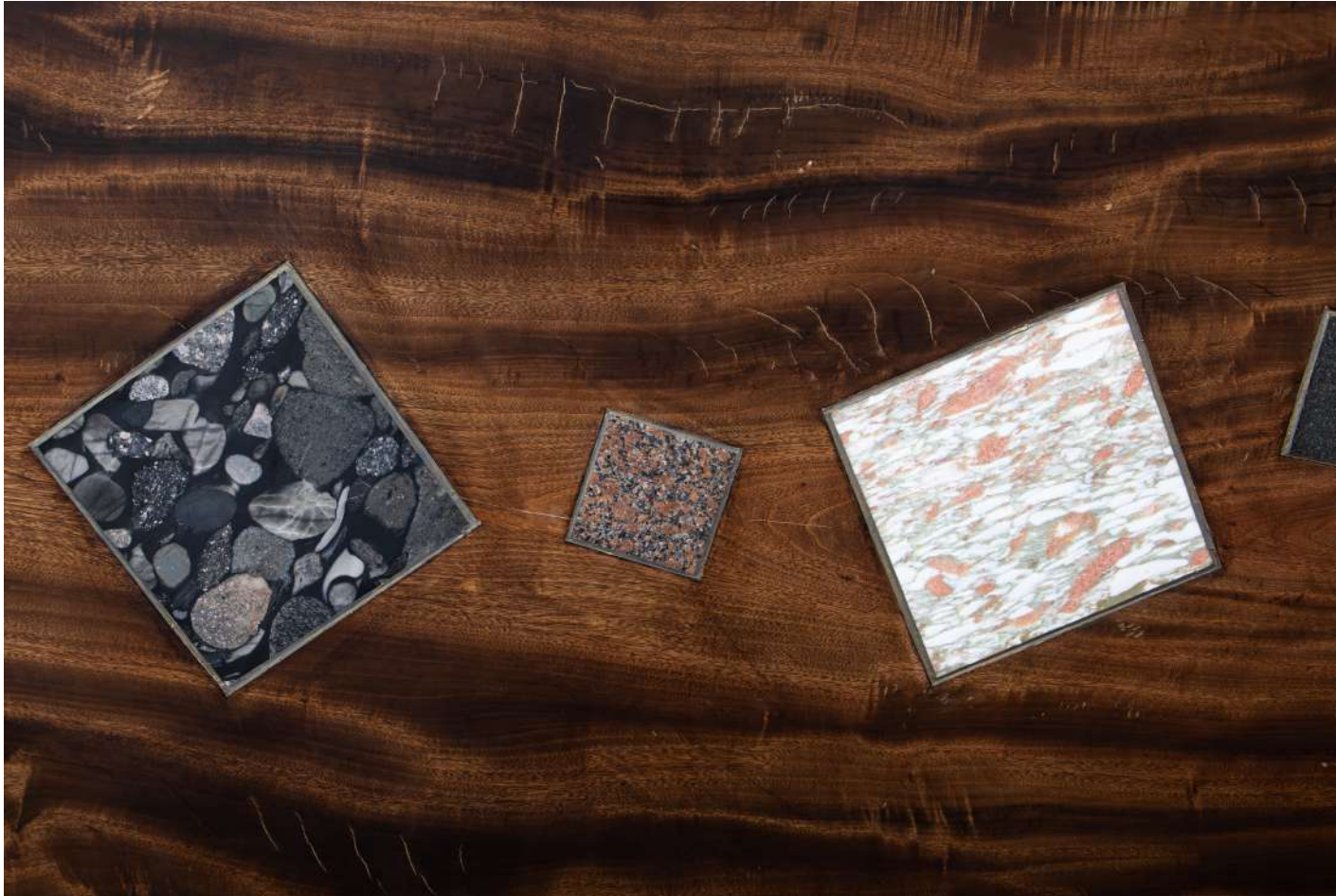
[ 表裏一体 / Conflicting concept ] ※一部