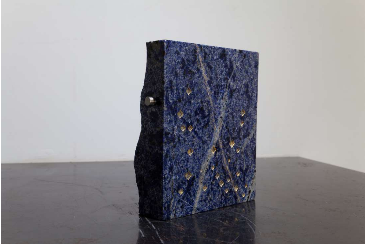
[ 魂の交差 / Intersection of souls ] 2023年 / 花崗岩 / 31,0×28,8×8,8(cm)