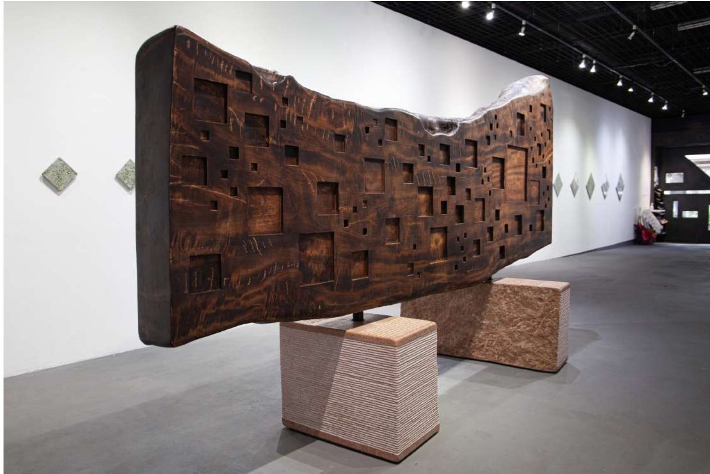
[ 表裏一体 / Conflicting concept ] 2022年 / 楠・花崗岩・砂岩・大理石・コーツァイト・鉄 / 205×345×110(cm)