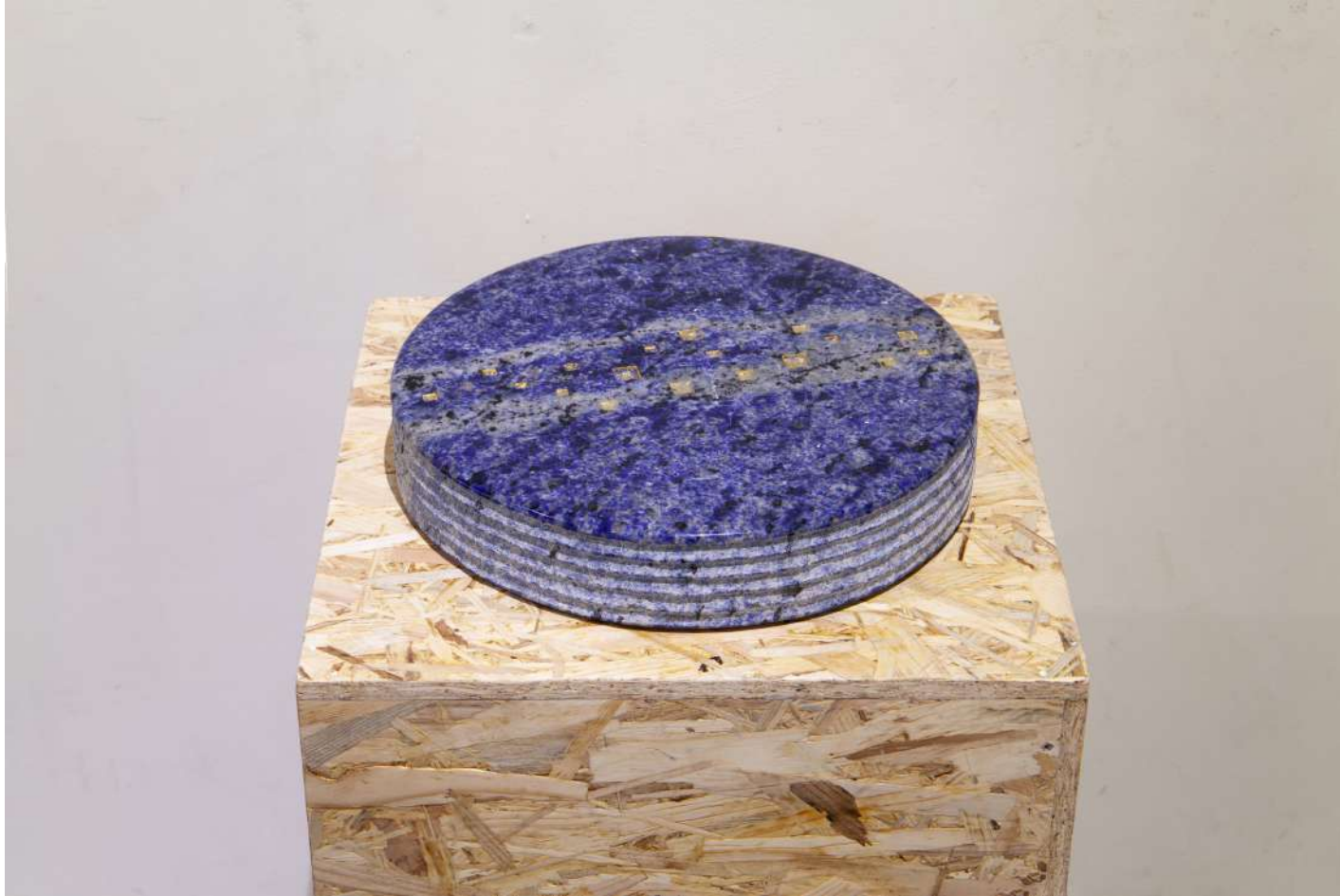
[ 青い星の願い / Blue star's wish ] 2023年 / 花崗岩 / 6,0×30,5×30,5(cm)