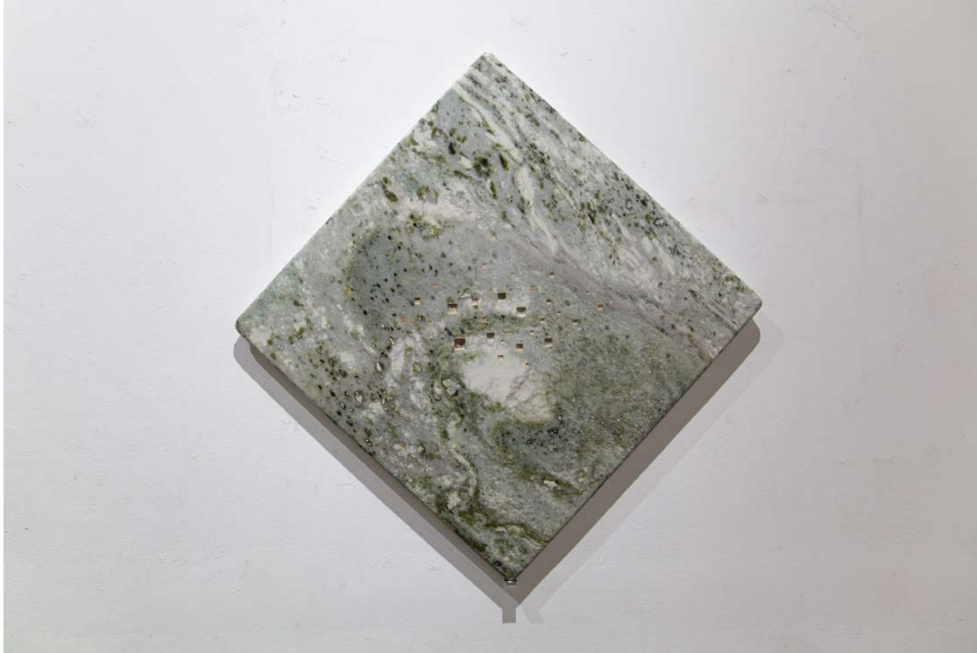
[ 石の声 / Stone poem '23 ] ※一部