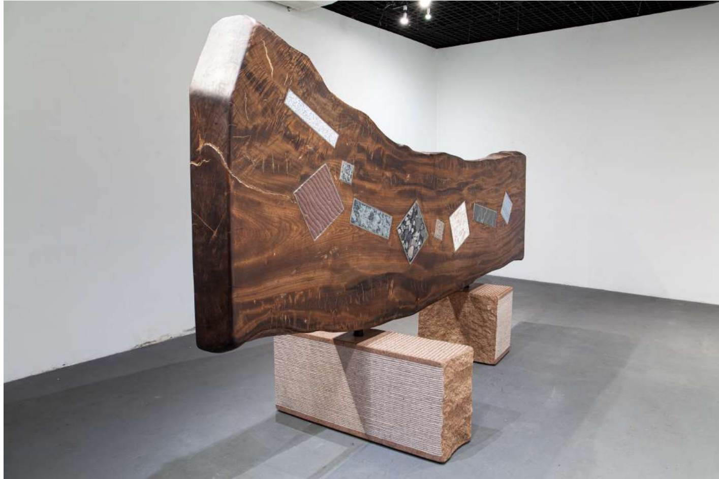
[ 表裏一体 / Conflicting concept ]