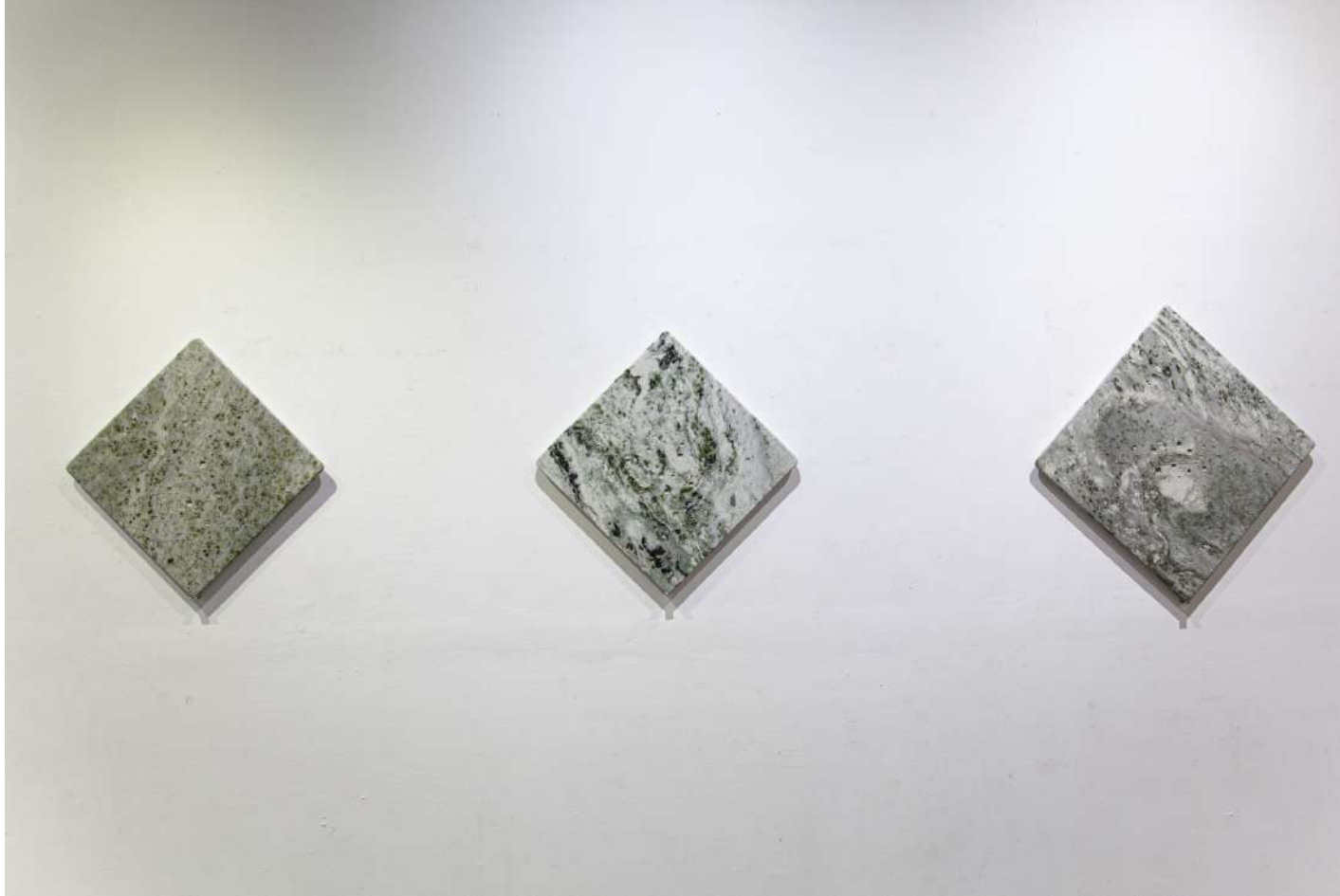
[ 石の声 / Stone poem '23 ] ※一部