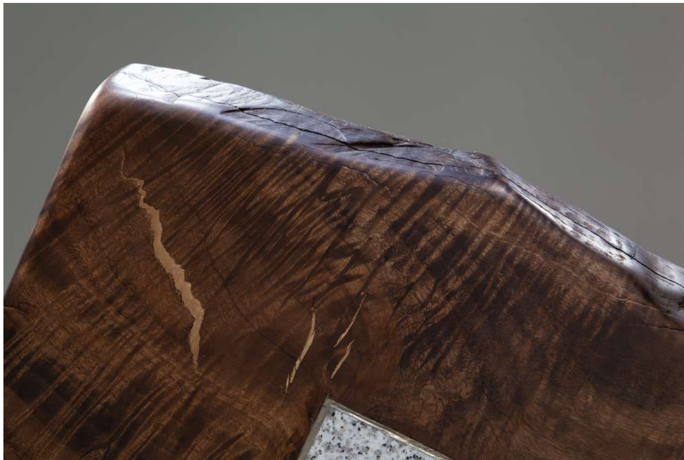
[ 表裏一体 / Conflicting concept ] ※一部