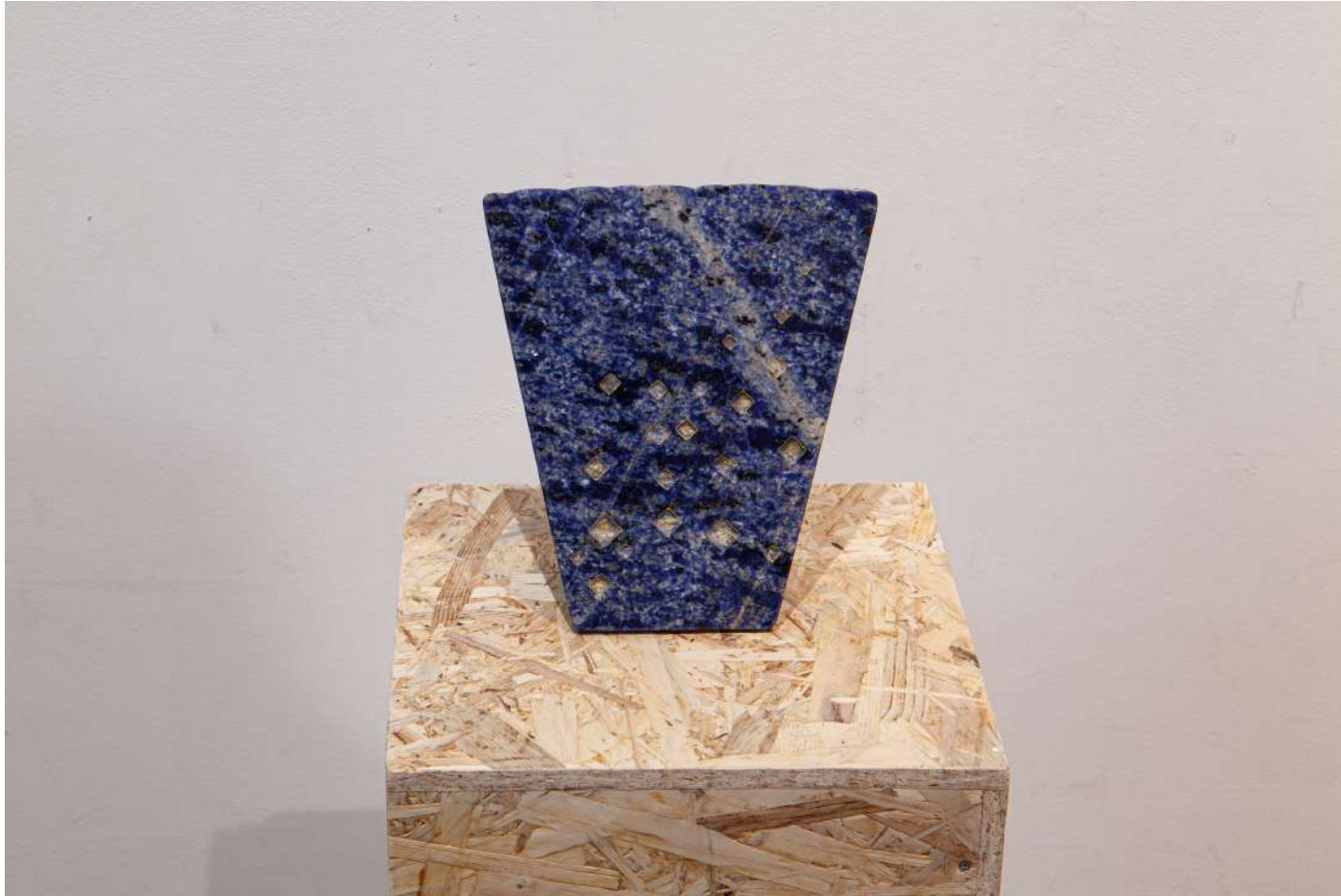
[ 地球の聲 '23-2 / Voice of the earth 2 ] 2023年 / 花崗岩 / 20,5×20,2×8,0(cm)