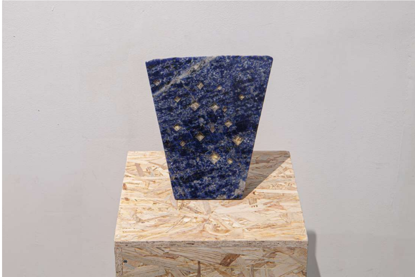
[ 地球の聲 '23-4 / Voice of the earth 4 ] 2023年 / 花崗岩 / 21,6×20,5×8,5(cm)