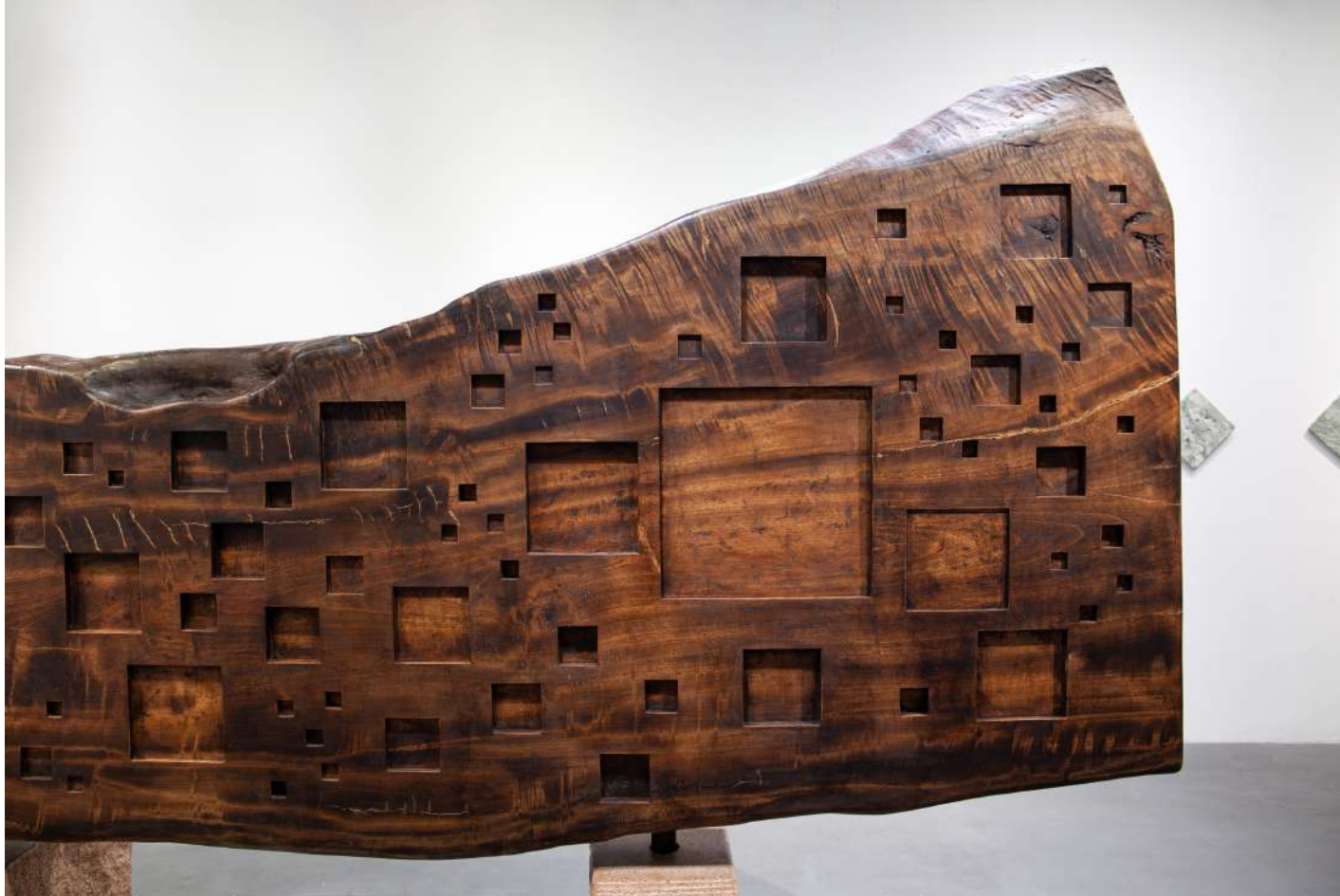
[ 表裏一体 / Conflicting concept ] ※一部