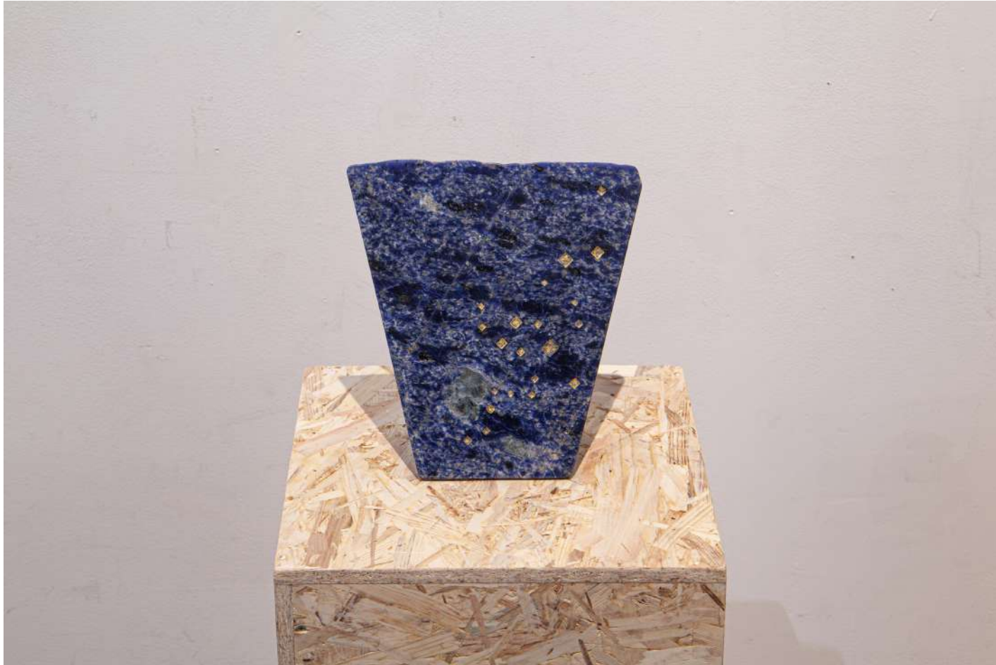
[ 地球の聲 '23-3 / Voice of the earth 3 ] 2023年 / 花崗岩 / 21,0×20,0×8,2(cm)