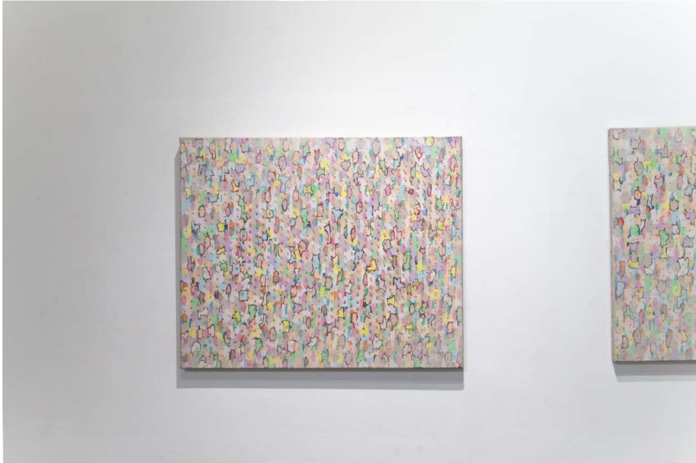
[ 大地の呼吸 1 / Breath of the earth ] 2012年 / ミクストメディア / 60,6×72,7(cm)