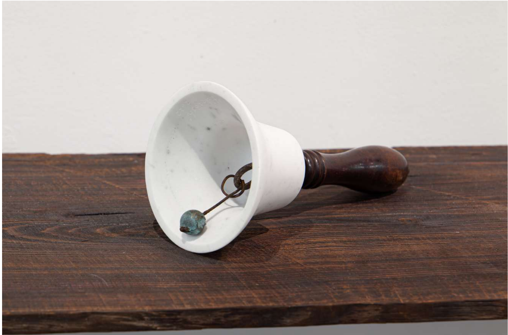
[ handbell ]