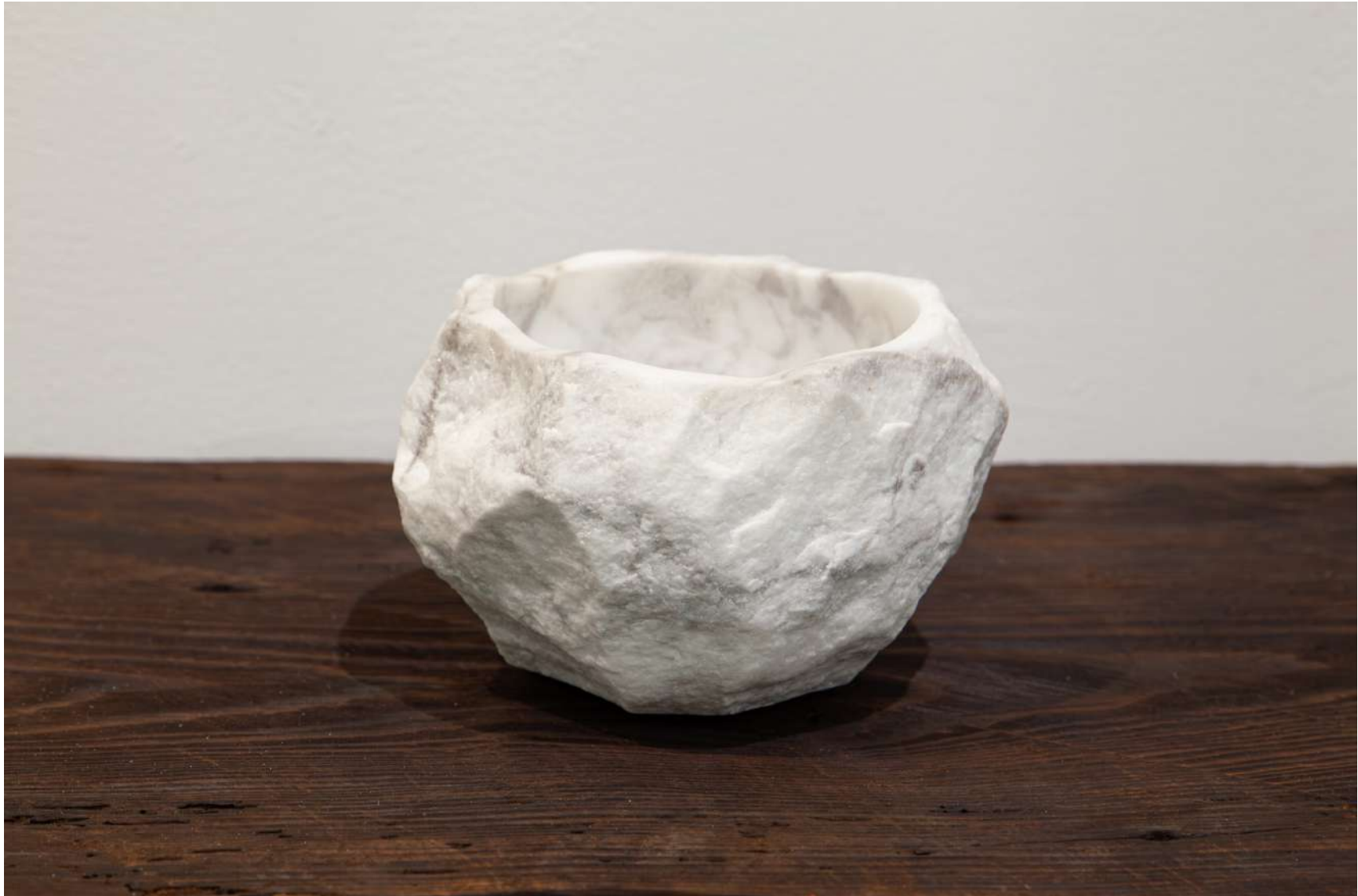
[ stone bowl ] 2023 / W14×H9×D14(cm) /大理石(白)