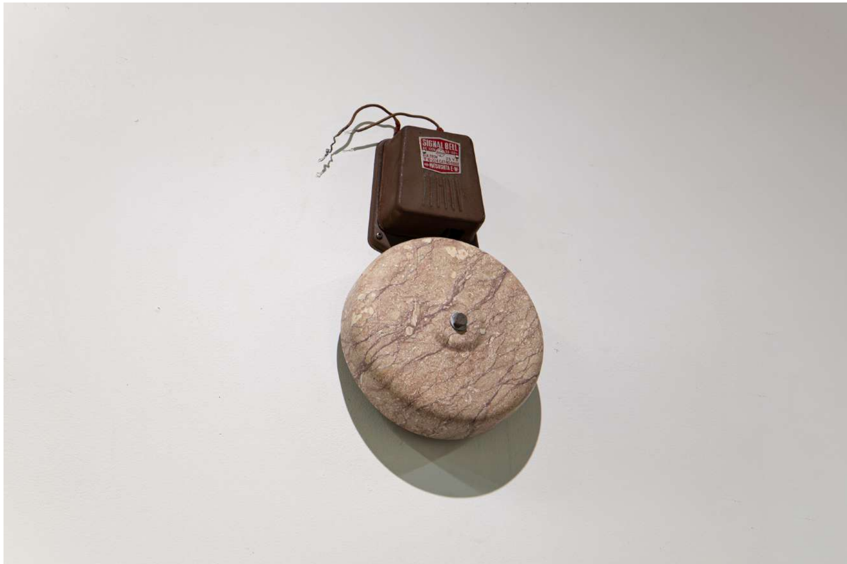
[ signal bell ]