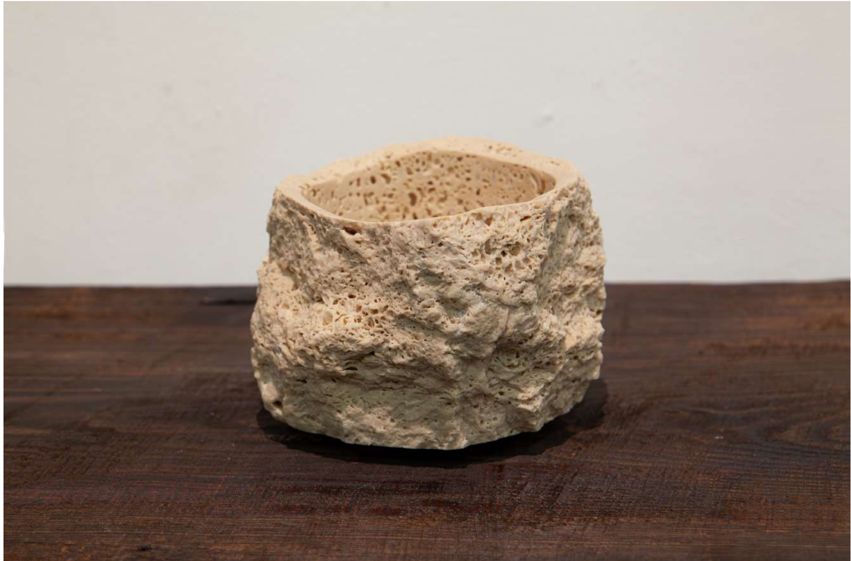
[ stone bowl ] 2023 / W14×H10×D14 (cm) / トラバーチン(黄)