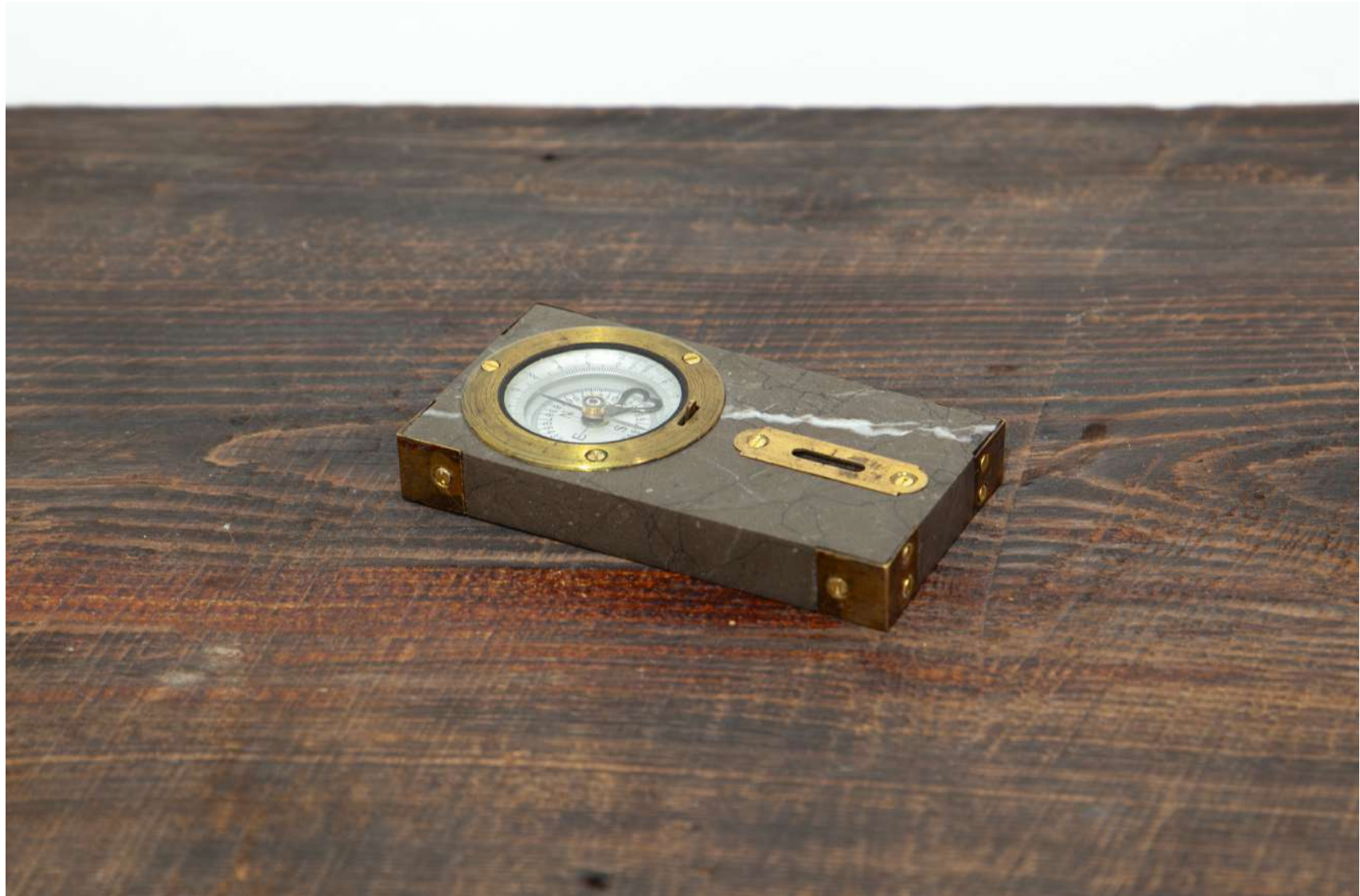
[ compass ]