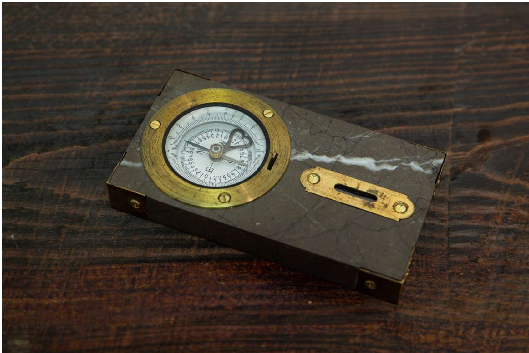
[ compass ]