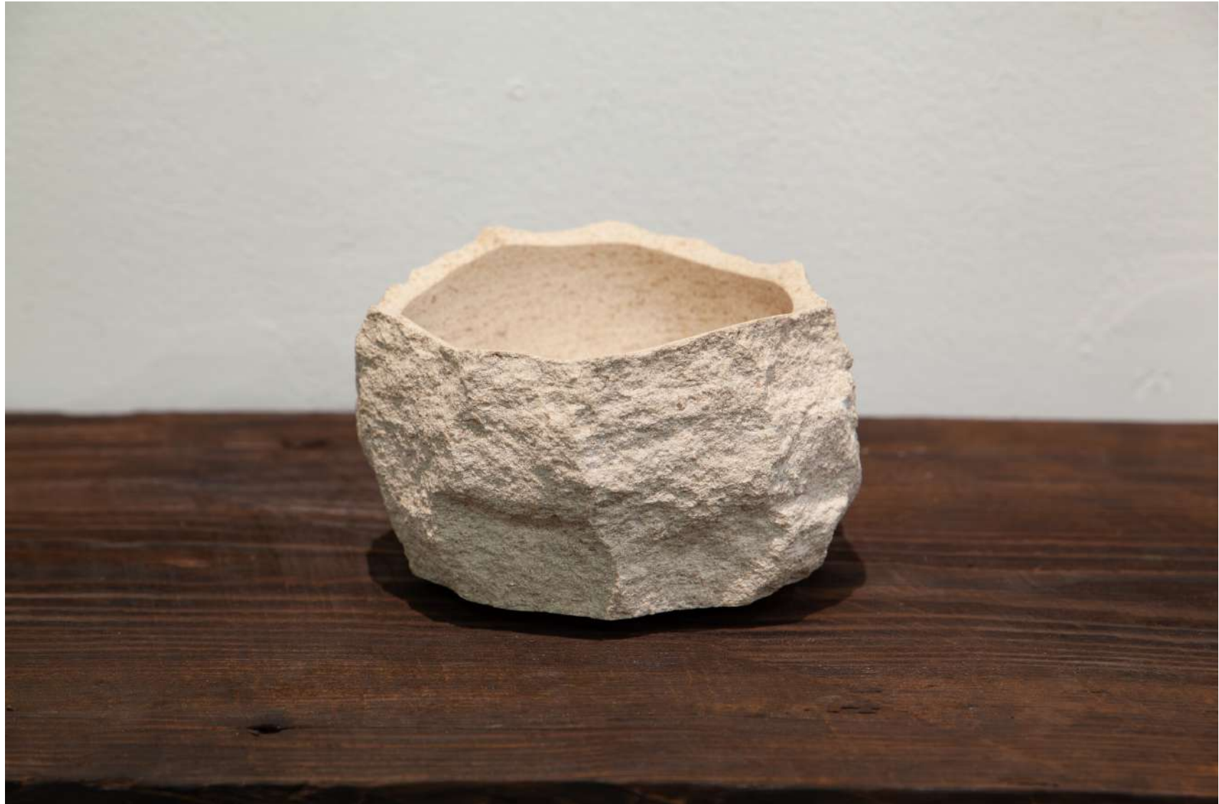
[ stone bowl ] 2023 / W14×H9×D14(cm) / ライムストーン(茶)