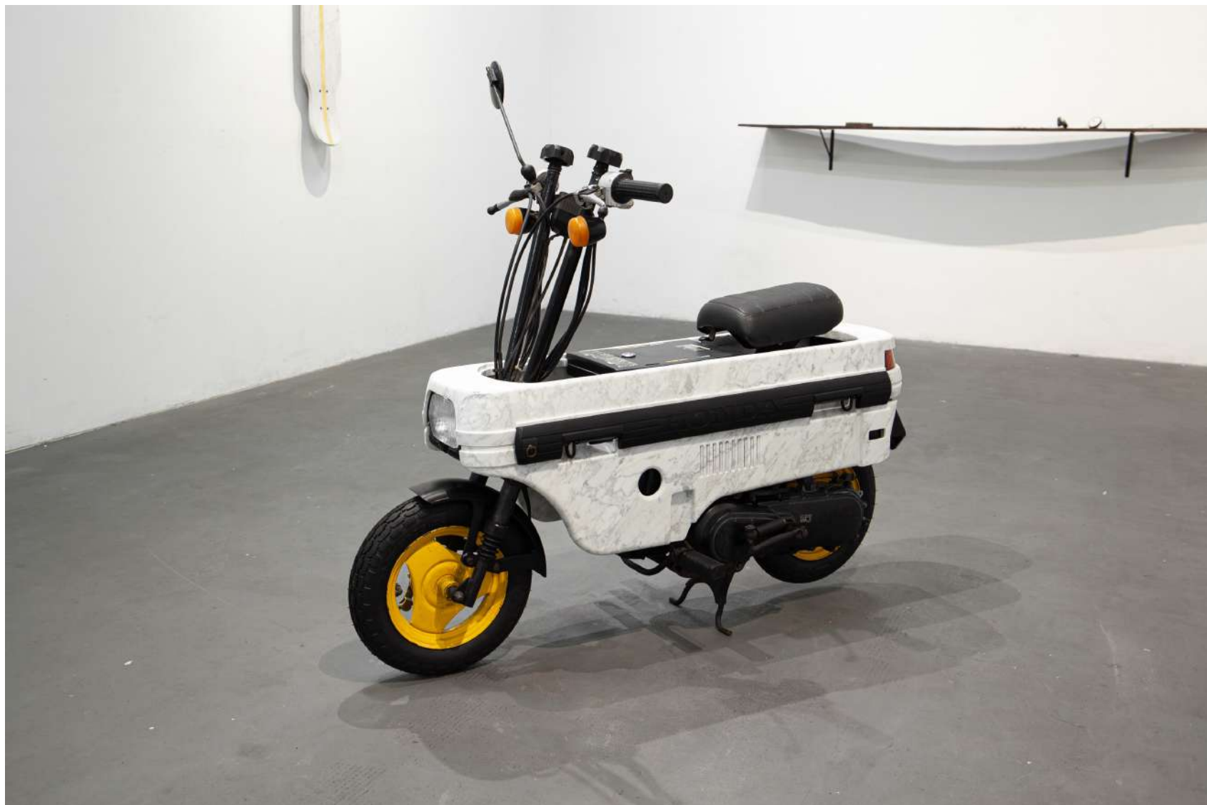
[ moto ]