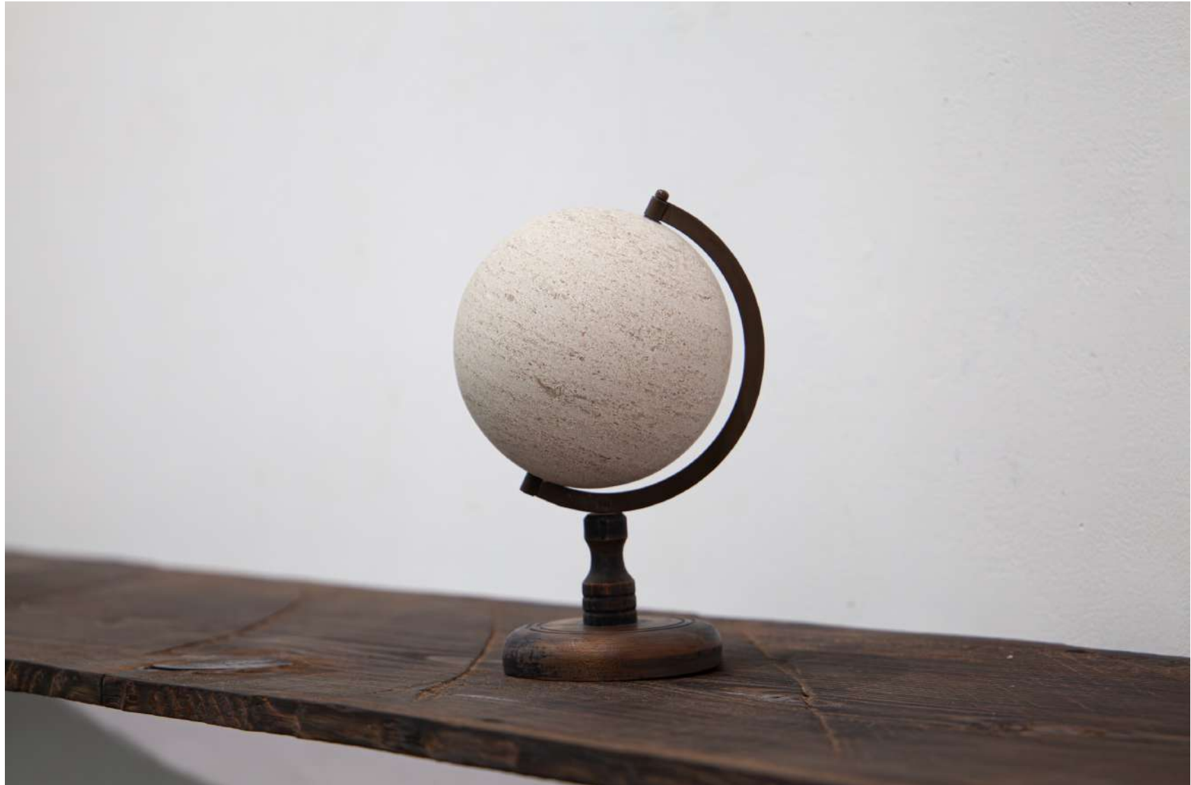
[ globe ]