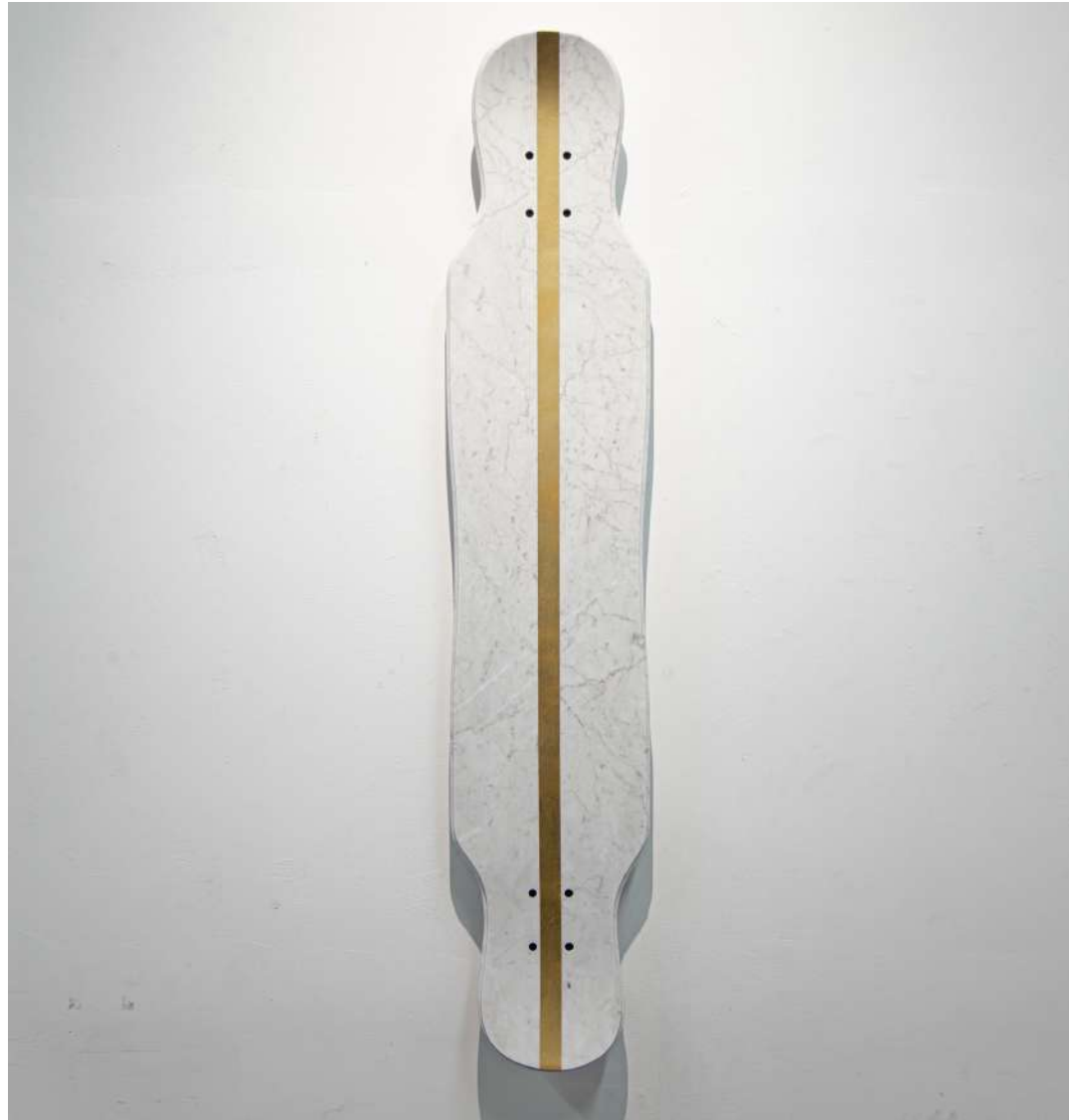
[ board ]