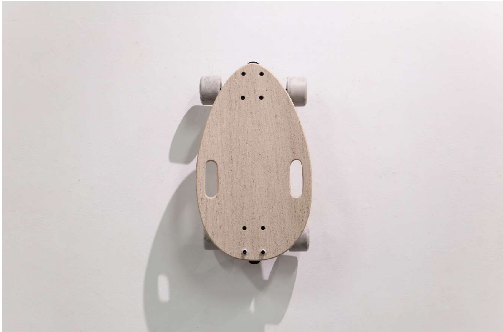
[ skateboard_elos ]