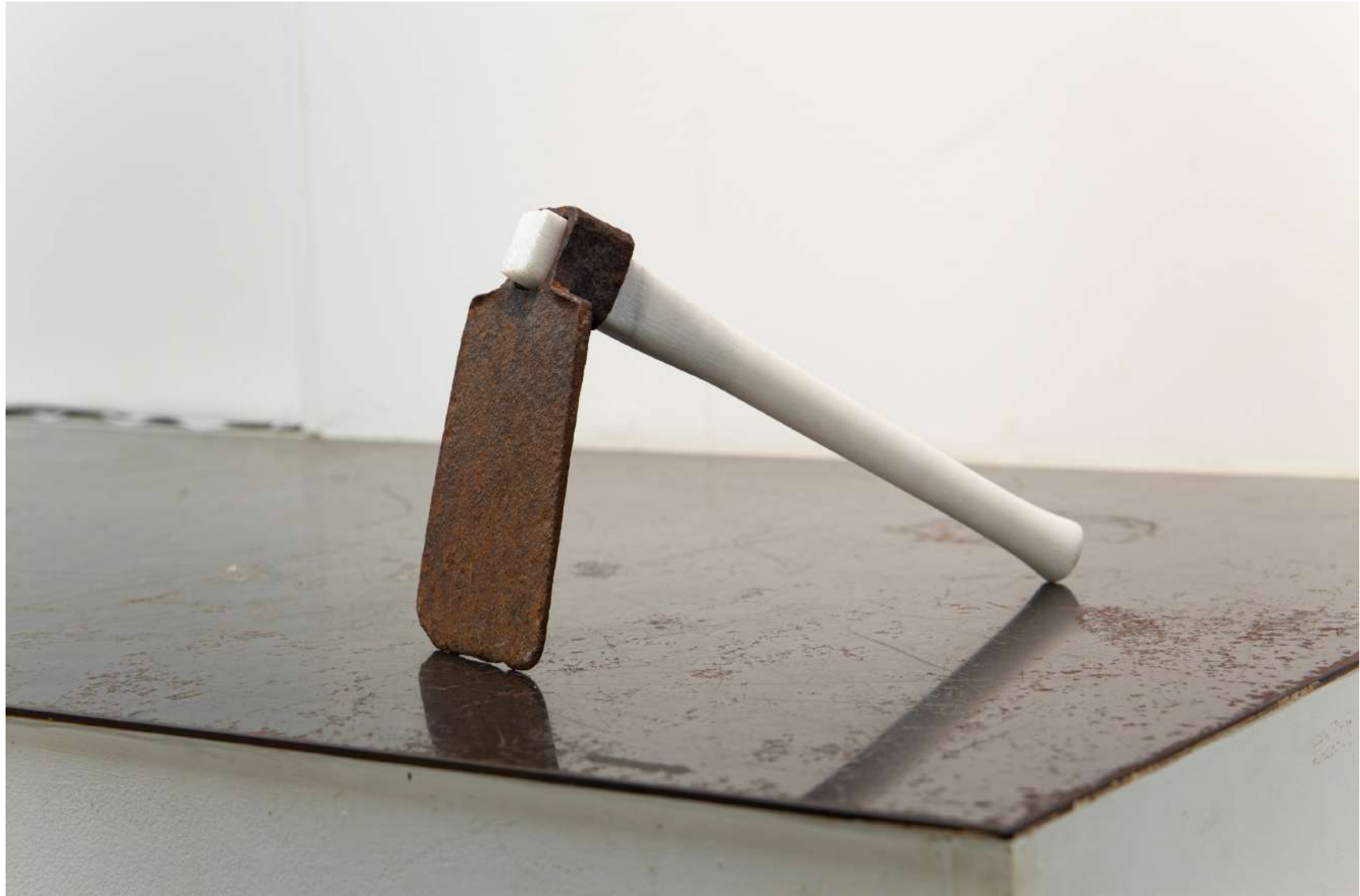
[ hoe ]